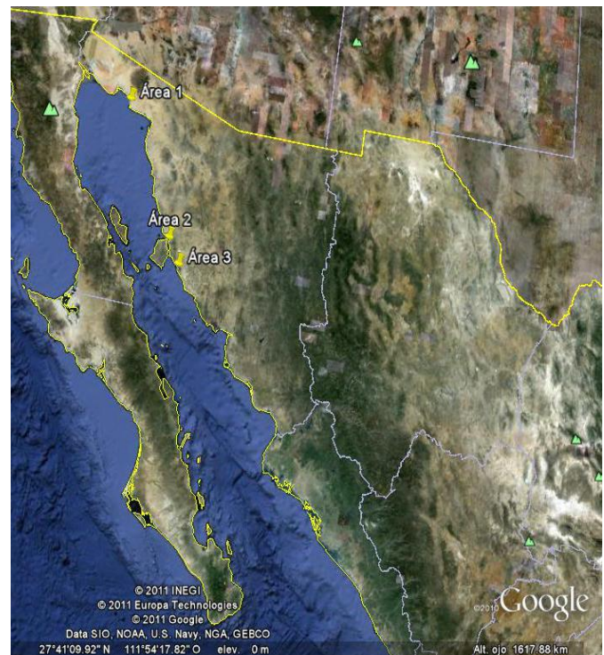
Figura 1. Áreas geográficas muestreadas en el estado de Sonora (Golfo de California) área uno (1) (norte del estado de Sonora); áreas dos y tres (2, 3) (sur del estado de Sonora).

materia orgánica se consideró con base a la técnica de Licon et al. (2001). Los resultados se expresaron en porcentaje.